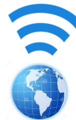
2016 – Hotspots Mundo

A presença de hotspots Wi-Fi no mundo já atinge hoje a marca de 116 milhões